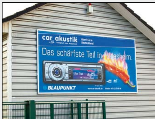
BigPrint (4 x 2 mtr.) im Kederschienen-Rahmen car akustik