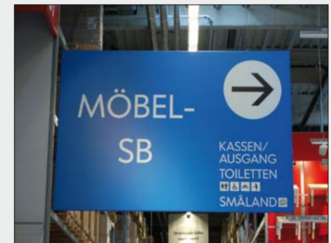
BigPrint mit umlaufendem Metallrahmen von der Decke abgehängt