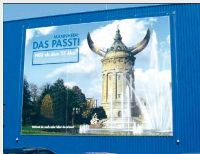
BigPrint (12 x 8 mtr.) mit Liftersystem auf Trapezblech-Fassade