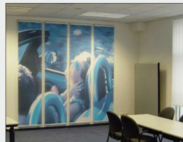
BigPrint mit Kederschienen oben und unten zur Wandmontage in Konferenzräumen