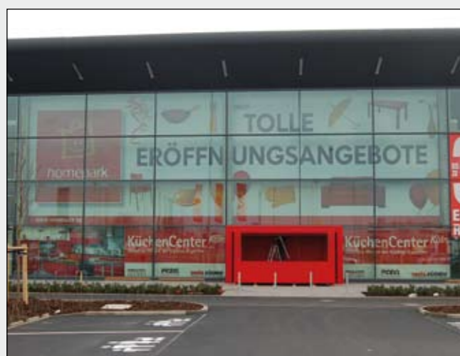
BigPrint mit Kederschienen oben und unten als Glasfassaden-Verkleidung