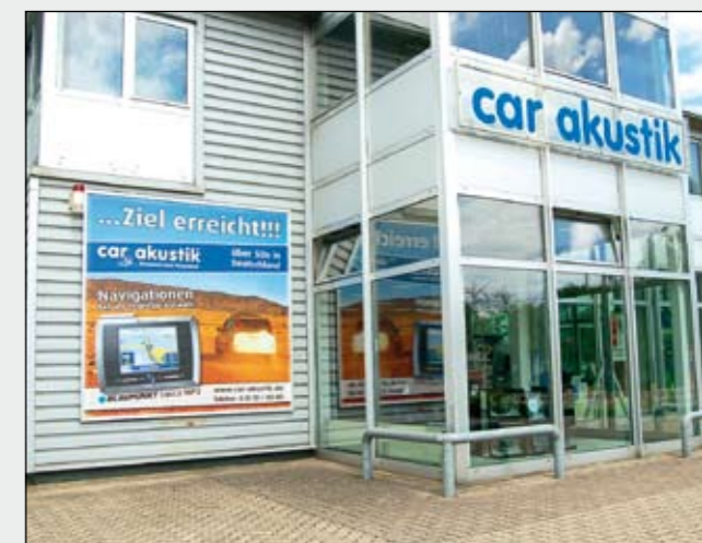
BigPrint (2,5 x 2,5 mtr.) im Kederschienen-Rahmen car akustik