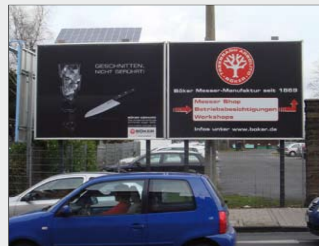
BigPrint (3,5 x 2,5 mtr.) im Kederschienen-Rahmen BÖKER Solingen