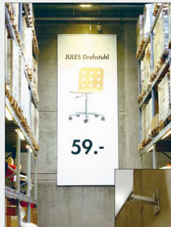
BigPrint mit Kederschienen oben und unten zur Wandmontage