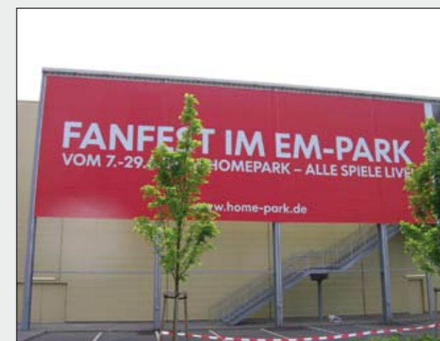
BigPrint (34 x 7 mtr., geteilt) mit Liftersystem auf vorhandener Stahlkonstruktion