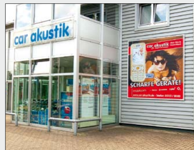
BigPrint (2,5 x 2,5 mtr.) im Kederschienen-Rahmen auf Blech-Fassade