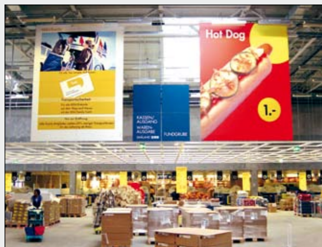
BigPrint mit umlaufendem Metallrahmen von der Decke abgehängt

Auch im Innenbereich bieten wir maßgeschneiderte Produkte für Ihre Großplakate: