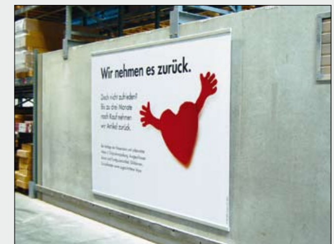
BigPrint mit Kederschienen oben und unten zur Wandmontage