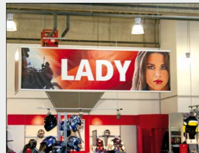
BigPrint mit Kederschienen oben und unten von der Decke abgehängt